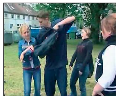
Abb. 1: Die tägliche Rängelei an der Bushaltestelle macht den Schulweg für viele zum Spießrutenlauf.

Situationen vermeiden kann. Die Schüler erarbeiten und üben handhabbare Strategien zur Konfliktlösung und Konfliktvermeidung - z.B. durch die richtige Sitzplatzwahl in Bussen und Bahnen. Sie lernen auch, wie man anderen helfen kann, ohne sich selbst in Gefahr zu bringen und wie man auf erlebte Gewalt am bes-