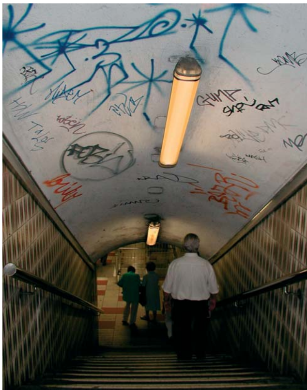
Abb. 4: Duster und unübersichtlich: An Haltestellen des ÖPNV fürchten sich viele. In unterschiedlichen Befragungen gaben regelmäßig mehr als die Hälfte der Befragten zu, sich dort unwohl zu fühlen.

Wie können sich Jugendliche nun in diesem für sie beängstigenden Raum bewegen und wie sollen sie sich in Bedrohungssituationen verhalten? Diese Fragen werden beim Projekttag der Bochumer Polizei u. a. in einem „Busspiel“ thematisiert. Für dieses Spiel wird der Innenraum eines Busses mit Stühlen nachgebaut und einige Schüler setzen sich in diesen „Bus“ (Abb. 5). Dann spielen sie den Fall von Julian nach: Ein in der letzten Reihe sitzender Schüler wird von zwei anderen bedrängt und beraubt. Im Anschluss an das Spiel erörtert die Gruppe, auf welchen Plätzen die Gefahr, Opfer einer Straftat zu werden, besonders groß ist und wie man durch entsprechendes Verhalten im Vorfeld verhindern kann, selbst Opfer zu werden. Die Verhaltens- und Hilfsstrategien erarbeiten die Teilnehmer unter Anleitung der Polizei selbst und halten sie in Form von er-